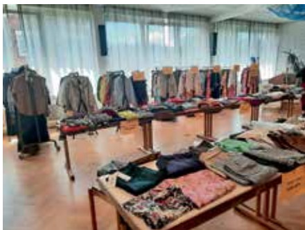
Kleiderverkauf vom Verein Nashipai Kenya für einen guten Zweck

Der am 10. und 11.06.2022 durchgeführte Kleidermarkt im evangelischen Gemeindehaus unter dem Motto „Shoppen für einen guten Zweck“ war für den gemeinnützigen Müllheimer Verein „Nashipai Kenya – gemeinsam mit den und für die Maasai e.V.“ ein voller Erfolg. An beiden Tagen wurde der günstige Verkauf von hochwertiger Markenkleidung zu stark reduzierten Preisen sehr gut angenommen. Die Markenkleidung stammte aus dem Einzelhandel, die aufgrund von coronabedingten Schließungen nicht verkauft werden konnte und dem Verein „Aktion Hoffnung“ zur Verfügung gestellt wurde.