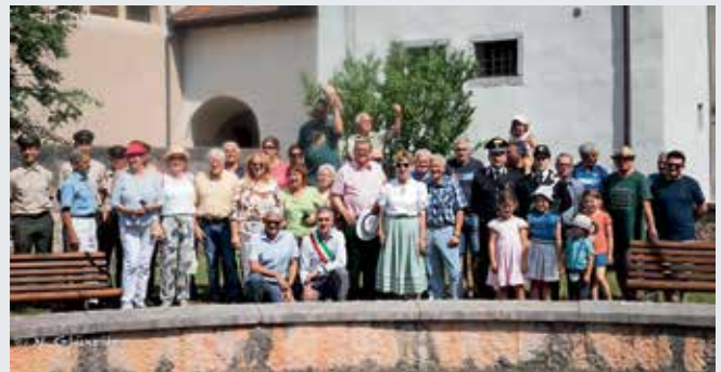
Anlässlich des 30-jährigen Bestehens der deutsch-italienischen Städtepartnerschaft zwischen Müllheim und Valle di Ledro besuchte eine Müllheimer Delegation die Partnerstadt Valle di Ledro.