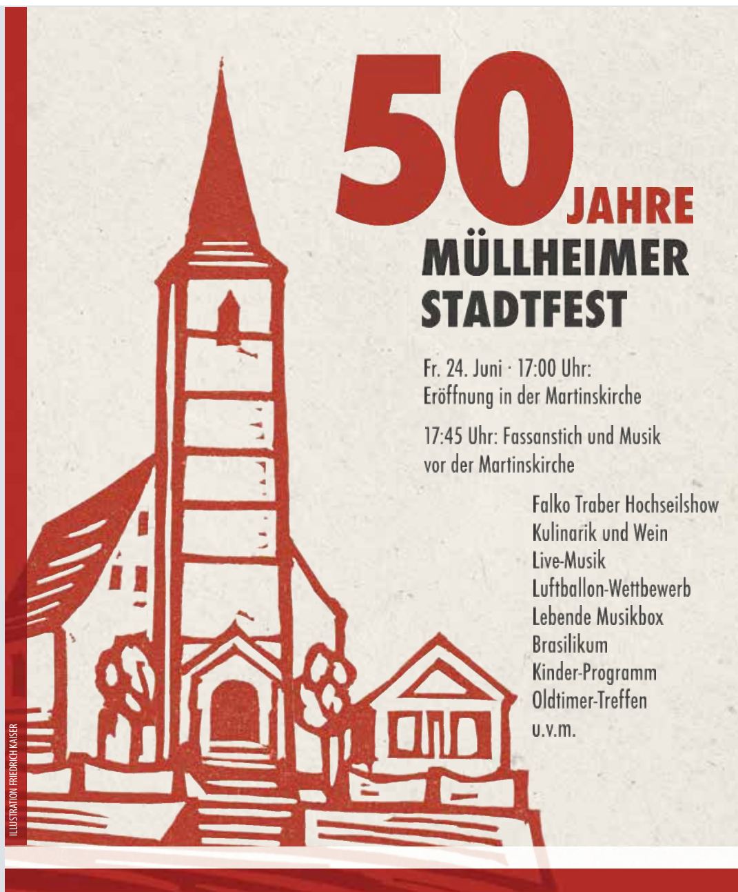
ILLUSTRATION FRIEDRICH KÄSER